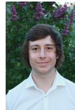
Jonas Einrichtung & Design