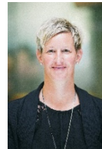
Nicole Organisation & Kommunikation