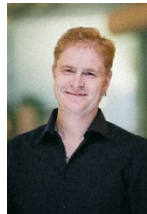
Jürgen Einrichtung & Design Objektplanung