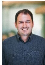
Karl Objektplanung, Architektur